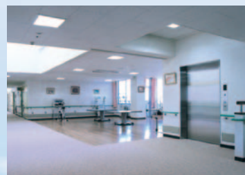
レクリエーションルーム・機能回復訓練室