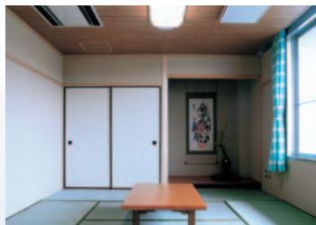
家族介護教室(和室)