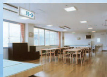
食堂・談話ホール